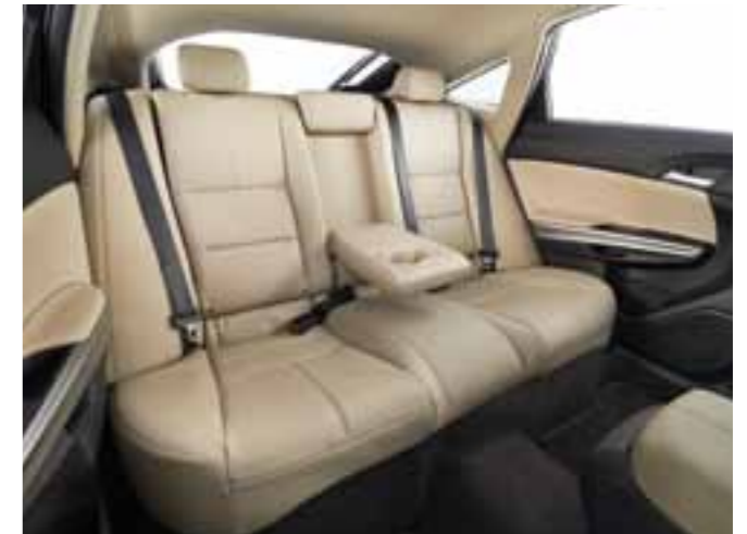
بإمكان كافة الركاب أن يتدللوا في فخامة راقية. All occupants can indulge in premium comfort.