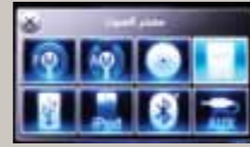
اختيار مصدر الصوت Audio source selection