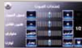
نافذة التحكم بالنظام الصوتي Audio settings window