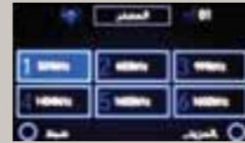
ضبط مسبق للراديو Radio presets