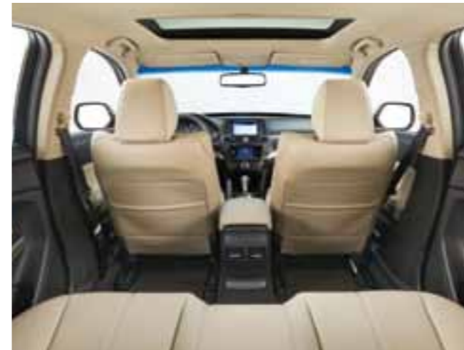
تتوفر رحابة واسعة لأقدام الركاب في الخلف. Generous legroom is provided for rear passengers.

اختبر الاسترخاء النادر عند انسياب أكورد كروس تور عبر الأماكن الجميلة. تمتع بالجلوس وسط المقاعد البيج الجلدية الفاخرة التي تحيط بك. مدد أطرافك بحرية في بيئة معاصرة أنيقة مع مقاعد مريحة على غرار راحة سيارة الصالون التي تتسع لخمسة أشخاص. واستمتع بالجو الرائع في الداخل بعيداً عن التوتر بسبب خاصية التحكم بالضجيج. متع نفسك بالنظر إلى القمر والنجوم وذلك من مقعدك أثناء قيادتك لهذه السيارة، وكأنك في غرفة المعيشة.