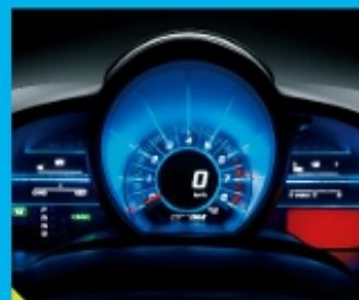
科幻魅力的 3D 仪表盘