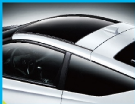
拓宽视野的全景天窗