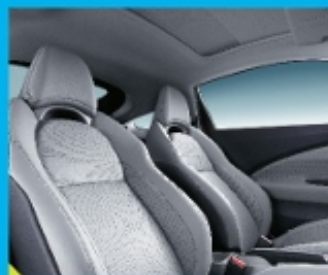
真皮质感的包裹型运动座椅