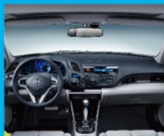
运动气质的仪表台