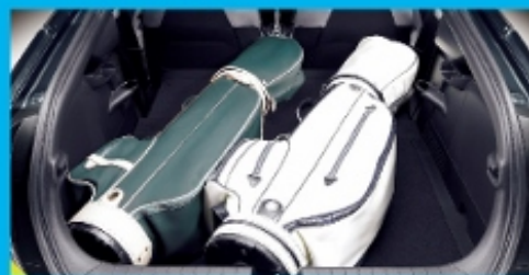
超越所想的行李箱空间