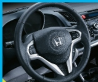
跑车风格的多功能方向盘