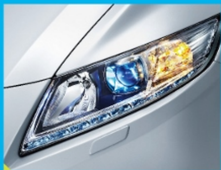
凌厉传神的节能前大灯