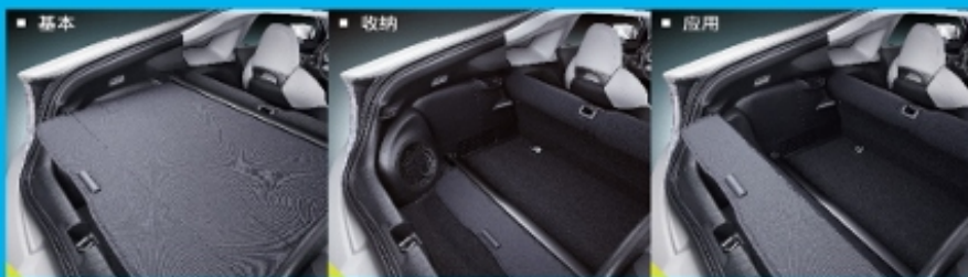
可调节的行李箱盖板, 实现 3 种行李箱利用模式