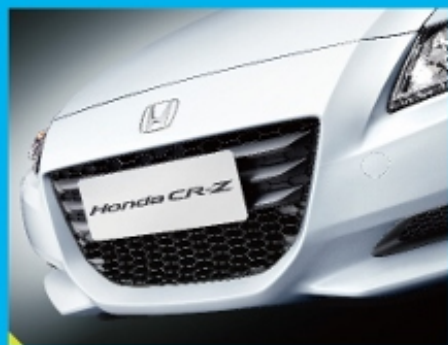
个性彰显的低重心运动前脸