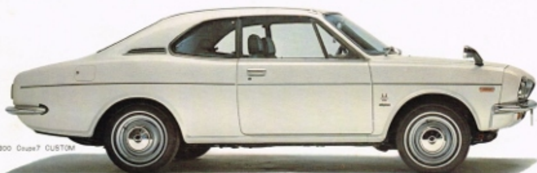
HONDA 1300 Coupe 7 CUSTOM