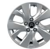
LLANTA NOTOS 16" EN C4 PICASSO Y GRAND C4 PICASSO