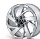
LLANTA GARBIN 16" (C) EN C4 PICASSO Y GRAND C4 PICASSO