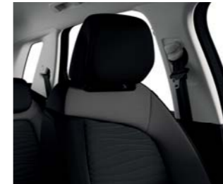
TEJIDO ONDULICE BITONO NEGRO/ GRIS ARDOISE (A)