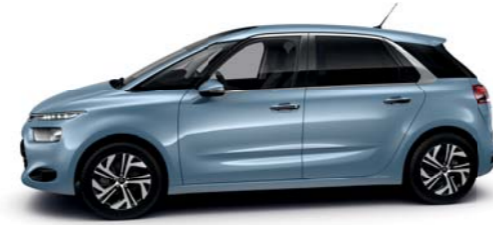
AZUL TELES (M)