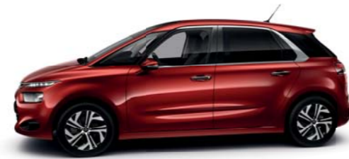
ROJO RUBÍ (N)