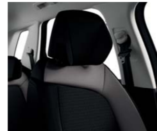
MIXTO CUERO FINN BITONO NEGRO/ GRIS ARDOISE (A)(B)