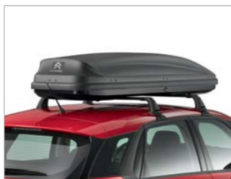
Cofre de techo