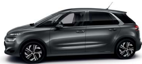
GRIS SHARK (N)