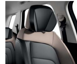
CUERO NAPPA BITONO NEGRO/ ÁMBAR NACARADO (A)(B)