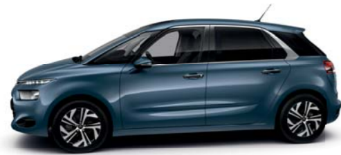
AZUL KYANOS (M)