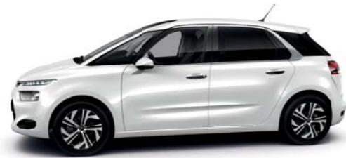
BLANCO BANQUISE (O)