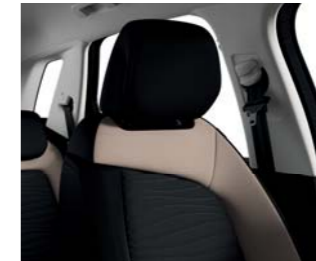
TEJIDO ONDULICE BITONO NEGRO/ ÁMBAR NACARADO (A)