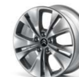
LLANTA LEVANT 17" (C) EN C4 PICASSO Y GRAND C4 PICASSO

(A) Y otros materiales de acompañamiento.