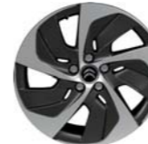
LLANTA BITONO ÉOLE 18" EN C4 PICASSO Y GRAND C4 PICASSO