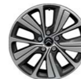
LLANTA AQUILLON 17" EN GRAND C4 PICASSO