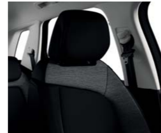
TEJIDO CALODRAS BITONO NEGRO/ GRIS ARDOISE (A)