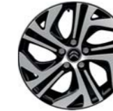
LLANTA BITONO ZEPH-HR 17" EN C4 PICASSO