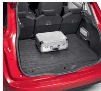
Cubeta de maletero