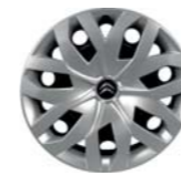
EMBELLECEDOR LOO 16" EN C4 PICASSO