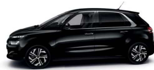
NEGRO ONYX (O)