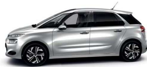
GRIS ALUMINIO (M)