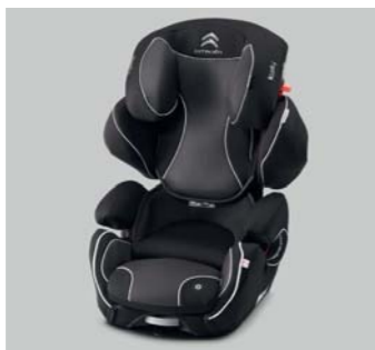
Silla Kiddy Cruiserfix Pro