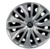
EMBELLECEDOR HEGOA 16" EN GRAND C4 PICASSO