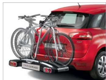
Porta bicicletas de plataforma sobre enganche de remolque

El CITROËN C4 PICASSO y el GRAND C4 PICASSO cuentan con un gran número de accesorios. Vea la totalidad de la oferta en nuestro folleto de accesorios.