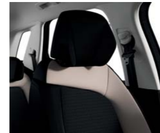
MIXTO CUERO FINN BITONO NEGRO/ ÁMBAR NACARADO (A)(B)