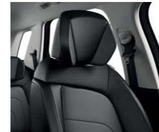
CUERO CLAUDIA MISTRAL (A)(B)