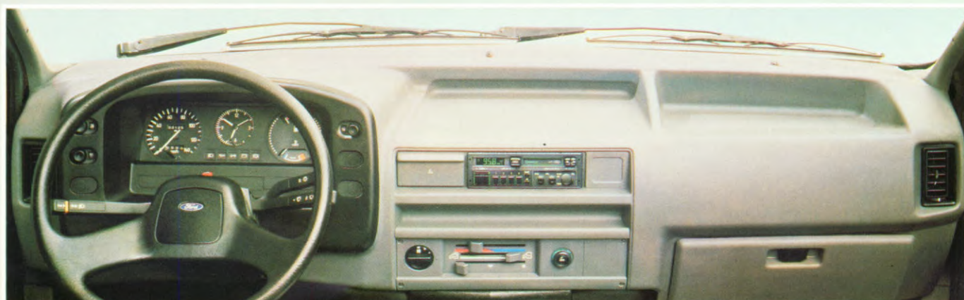
Stereo radio-cassette speler met anti-diefstal-beveiliging