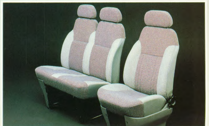
Voorstoelen met extra hoge rugleuningen