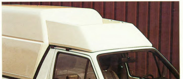
De dakbox: een slimme combinatie van een imperiaal en een dakspoiler.

Vergeet bovendien niet dat de Caddy een 'halve' Golf is. Met alle plezierige comfortabele voordelen vandien. De Caddy is ook voor uw bedrijf of instelling de ideale vervoersoplossing voor het lichte bestelvervoer.