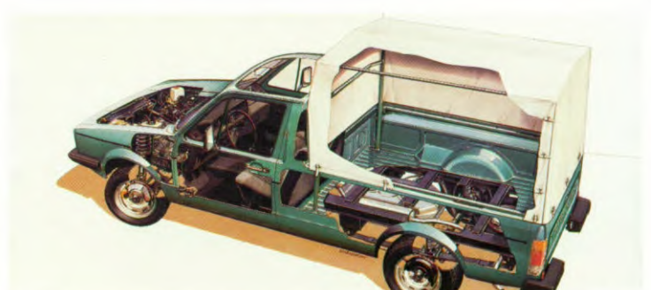
De Caddy: een oerdegelijke bedrijfswagen met het comfort van een personenauto.

De cabine is bijzonder functioneel uitgerust. Voor de chauffeur en bijrijder zijn er aparte anatomische stoelen. Uiteraard met hoofdsteunen. Zowel chauffeur als bijrijder beschikken over veel extra bergruimte voor papieren en andere spullen die ze voor hun werk nodig hebben. Het uitzicht naar voren en naar achteren is onder alle omstandigheden uitstekend. Daar zorgen de elektrische ruitensproeier, de tweetraps ruitewisser en de extra grote buitenspiegels wel voor.