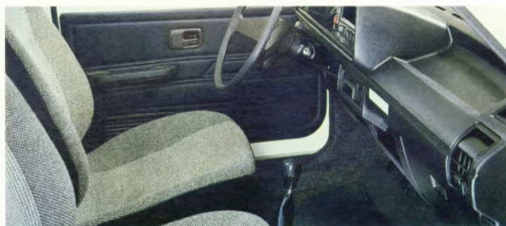
De cabine: ruim, comfortabel en functioneel.

De Caddy kan naar keuze worden uitgerust met een 1,6 liter benzinemotor van 55 kW/75 pk of een 1,6 liter dieselmotor van 40 kW/54 pk. Beide oerdegelijke motoren die zeer zuinig met brandstof zijn. De Caddy is niet alleen zeer handig, maar ook erg economisch. En als basis-auto zeer geschikt voor diverse opbouwvarianties.