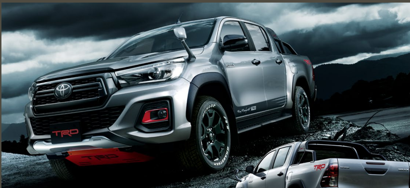
Photo: 特別仕様車 Z"Black Rally Edition"[ベース車両はZ]。ボディカラーはシルバーマेटリック(1D6)。フロントアンダースポイラー For "Black Rally Edition"、フォグランブペゼル For "Black Rally Edition"、マッドフラップ(ブラック)、ハイレスポンスマフラー、サイドデカル、フロントアンダーカバー、サイドステップ、スポーツバー、TRD ロゴデカルを装着しています。■写真は合成です。