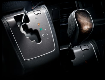
■ シフトベゼル (ダークシルバークラッシュ) ■ シフトノブ (本草+黒木目マホガニー調加飾)