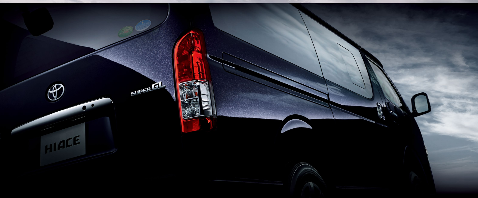
Photo: 特別仕様車スーパーGL "DARK PRIME II" (2WD・2800ディーゼル・標準ボディ) [ベース車両はスーパーGL (2WD・2800ディーゼル・標準ボディ)]. ボディカラーの特別設定色スパークリングブラックパールクリスタルシャイン<220>はメーカーオプション。

ダークな色調に、輝きをたたえて。 大人を満足させる質感。高い安全性へのこだわり。 そのスタイルで、装備で、 より深く、より大きな存在感を際立たせて。