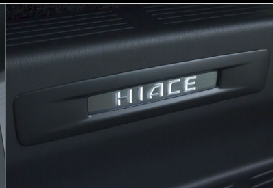
■ スライドドアスカッフプレート (車名ロゴ&イルミネーション付)