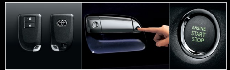
スマートキー ドアロック解錠・施錠 エンジンスイッチ