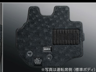
※写真は運転席側 (標準ボディ)