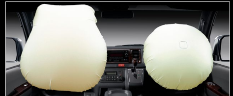
■ SRS*エアバッグ+プリテンショナー&フォースリミッター機構付シートベルト (助手席)

*SRS(乗員保護補助装置): Supplemental Restraint System ●SRSエアバッグおよびプリテンショナー機構は衝突の条件によっては作動しない場合があります。SRSエアバッグはあくまでシートベルトを補助する装置です。必ずシートベルトをご着用ください。●助手席エアバッグ装着時はチャイルドシートなどを助手席に装着する時は後ろ向きにしないなど、ご注意ください。●写真の項目は必ず取扱書をご覧ください。●写真は機能説明のためにSRSエアバッグが作動した状態を再現したものです。