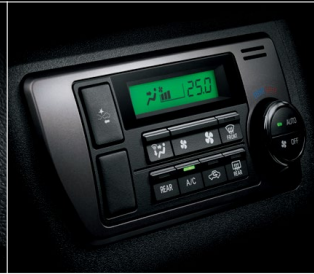
■ フロントエアコンプッシュ式コントロールパネル (ダークシルバークラッシュ)