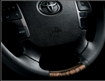
■ 4本スポークステアリングホイール (本草巻き+黒木目マホガニー調加飾)