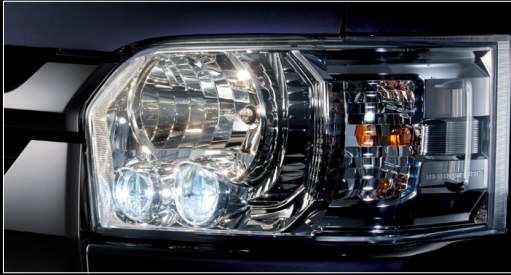
■ LEDヘッドランプ (クリアスモーク加飾)