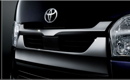
■ メッキフロントグリル (ダークメッキ)