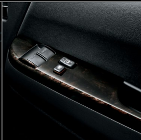
■ フロントドアトリム (合成皮革) ■ パワーウィンドウスイッチベース (黒木目マホガニー調加飾)