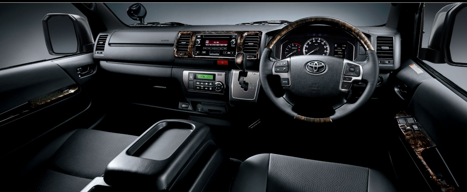
Photo: 特別仕様車スーパーGL "DARK PRIME II" (2WD・2800ディーゼル・標準ボディ)[ベース車両はスーパーGL(2WD・2800ディーゼル・標準ボディ)]の計器盤。 CD・AM/FMはメーカーオプション。■写真の計器盤は機能説明のために各ランプを点灯させたものです。実際の走行状態を示すものではありません。

深い輝きを放つダークな仕上がりのインテリア。全体のトーンをブラック系で統一しながら、シートサイドのステッチや黒木目マホガニー調加飾などでシックな遊び心を表現。