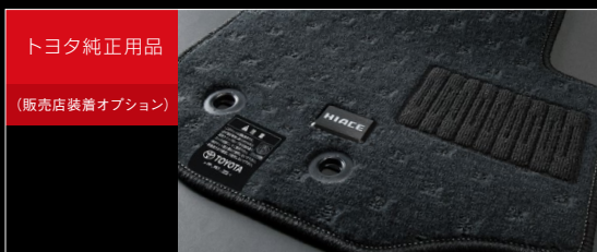
トヨタ純正用品 (販売店装着オプション)

⚠️ 注意: 植込み型心臓ペースメーカー等の機器をご使用の方は、電波によりこれらの機器に影響を及ぼすおそれがありますので、車両に搭載された発信機から約22cm以内に植込み型心臓ペースメーカーなどの機器を近づけないようにしてください。電波発信を停止することもできますので販売店にご相談ください。