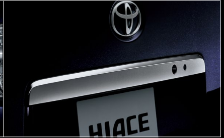
■ メッキバックドアガーニッシュ (ダークメッキ)