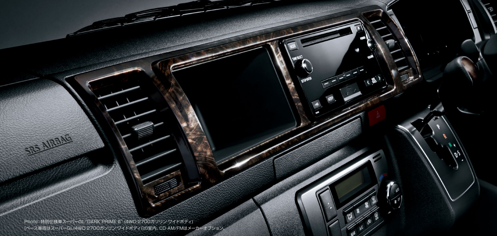
Photo: 特別仕様車スーパーGL "DARK PRIME II" (4WD・2700ガソリン・ワイドボディ) [ベース車両はスーパーGL(4WD・2700ガソリン・ワイドボディ)の室内。CD・AM/FMはメーカーオプション]