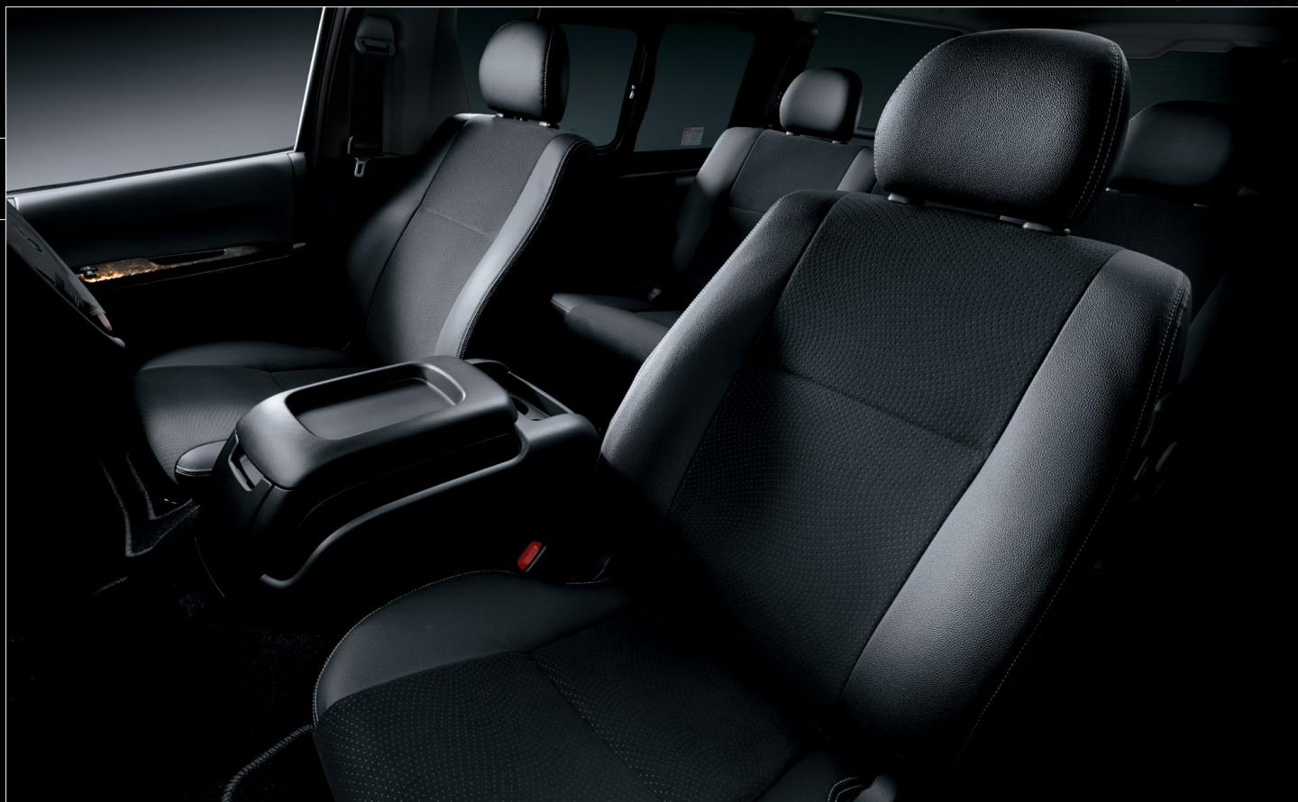
Photo: 特別仕様車スーパーGL "DARK PRIME II" (2WD-2800ディーゼル標準ボディ)[ベース車両はスーパーGL(2WD-2800ディーゼル標準ボディ)]の室内。

Photo: 特別仕様車スーパーGL "DARK PRIME II" (4WD-2700ガソリンワイドボディ) [ベース車両はスーパーGL(4WD-2700ガソリンワイドボディ)]. ボディカラーのホワイトパールクリスタルシャイン<070>はメーカーオプション。