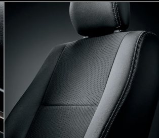
■ シート表皮: トリコット+合成皮革 & ダブルステッチ (ダークグレー)