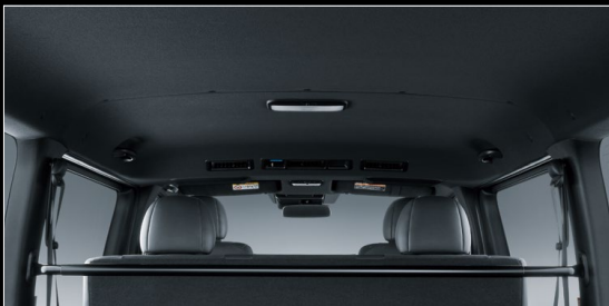
■ ルーフ&ピラー&セパレーターバー (ブラック)

*SRS(乗員保護補助装置): Supplemental Restraint System ●SRSエアバッグおよびプリテンショナー機構は衝突の条件によっては作動しない場合があります。SRSエアバッグはあくまでシートベルトを補助する装置です。必ずシートベルトをご着用ください。●助手席エアバッグ装着時はチャイルドシートなどを助手席に装着する時は後ろ向きにしないなど、ご注意ください。●写真の項目は必ず取扱書をご覧ください。●写真は機能説明のためにSRSエアバッグが作動した状態を再現したものです。