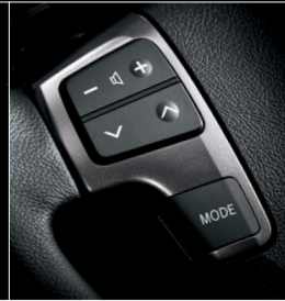
■ ステアリングスイッチ (オーディオ) & ベゼル (ダークシルバークラッシュ)