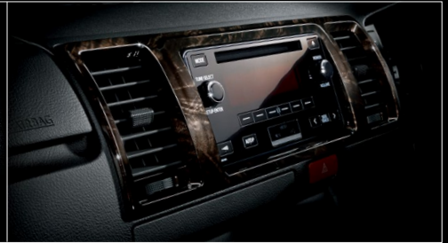
■ インstrumentパネルアッパー部 (黒木目マホガニー調加飾) ※写真のCD・AM/FMはメーカーオプション。