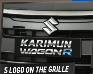
S LOGO ON THE GRILLE