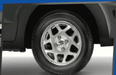
13" STAR SHAPE ALLOY WHEEL