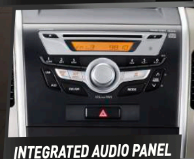
INTEGRATED AUDIO PANEL