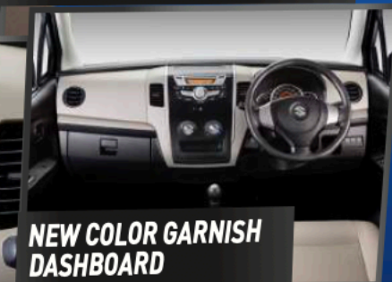
NEW COLOR GARNISH DASHBOARD