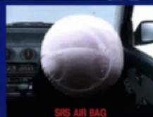
SRS AIR BAG

コンセプトは“リーボック”。 フォルムもインテリアも スタイリッシュ・スポーティ。