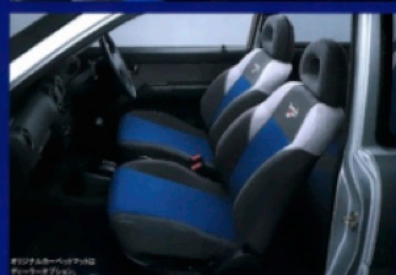
●フロントシートはトリコットシート地

コンセプトは“リーボック”。 フォルムもインテリアも スタイリッシュ・スポーティ。