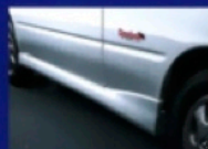
●サイドスポイラー