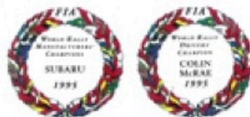
スバルはWRC(世界ラリー選手権)メーカー&ドライバーチャンピオンでも。

●燃費には消費税は含まれていません。消費税は20%の税率を、税別時、税別時にもなり消費税は別途申し受けます。●登録にともなう手数料は別料金です。●登録にともなう手数料は別料金です。●登録にともなう手数料は別料金です。●登録にともなう手数料は別料金です。