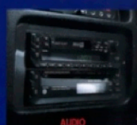
●CDプレーヤー付 ADDGEST製オーディオ