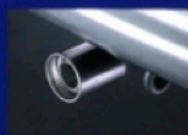
●マフラーカッター