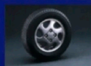
●チタンカラーアルミホイール

SUBARU SPORTS SPECIAL SUBARU SPORTS SPECIAL SUBARU SPORTS SPECIAL