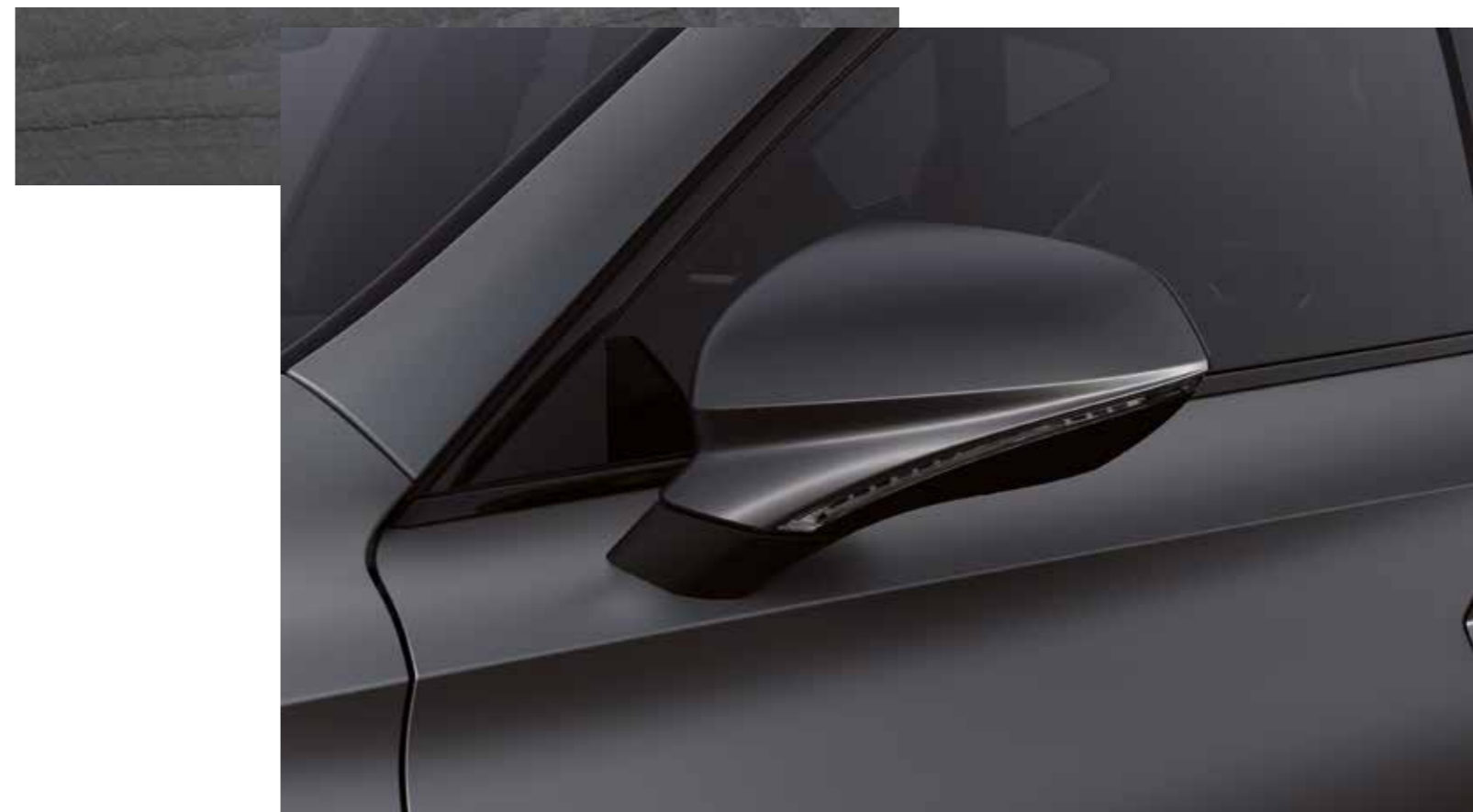
GRIS MAGNETIC MATE