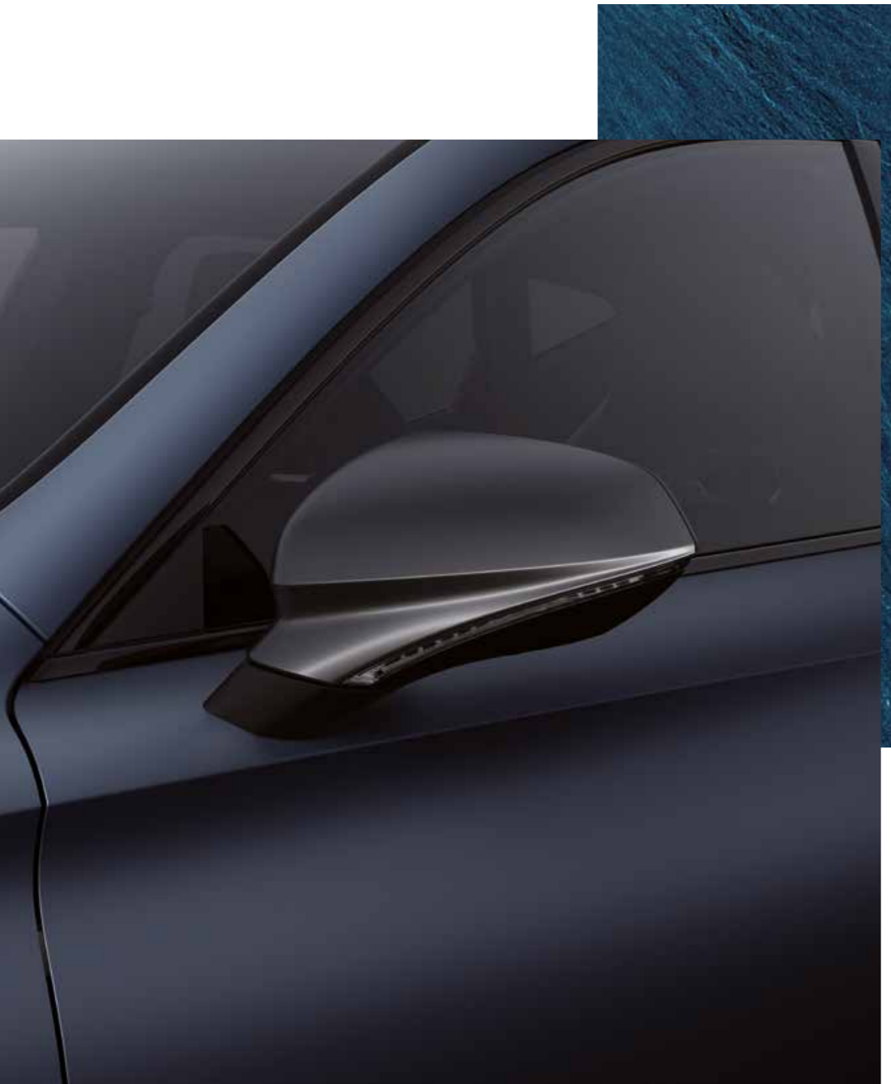
AZUL PETROL MATE