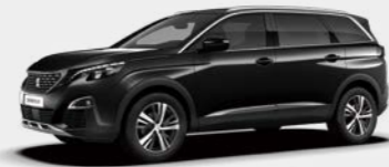
Nera Black (9VM0)