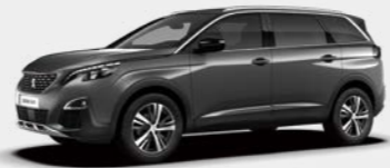
Nimbus(Platinum) Grey (VLM0)