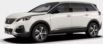
Pearl White (N9M0)