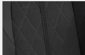
Plastic-coated fabric, Alcantara®, and Copper topstitching (GT)