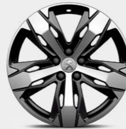
18 'LOS ANGELES' Diamond Alloy Wheels