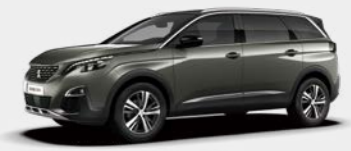
Amazonite(Smart) Grey (KLM0)