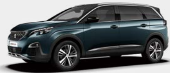
Emerald Crystal (DZM0)