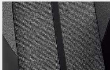
Plastic-coated fabric and Piedimonte upholstery (Allure)