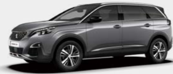
Cumulas(Artense) Grey (F4M0)