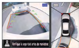
Vista trasera y cenital

Conéctate con tu auto como nunca habías podido, con las tecnologías de Nissan Intelligent Mobility. Nissan Altima® te permite controlar todo a tu alrededor mientras disfrutas la emoción de estar atrás del volante y sentir la confianza de tener una ayuda extra cuando tu conducción la requiera.