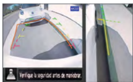
Vista trasera y lateral