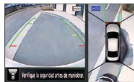
Vista frontal y cenital

INTELLIGENT AROUND VIEW MONITOR (Monitor Inteligente de Visión Periférica) Simula una vista aérea de 360° para que puedas tener una perspectiva de todo lo que te rodea, además el sistema de Detección de Objetos en Movimiento te alerta sobre obstáculos, peatones y objetos en movimiento, ayudándote a prevenir accidentes.