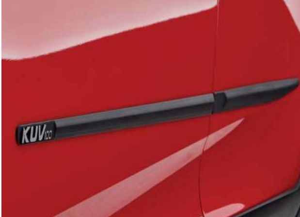
Perfiles de las puertas