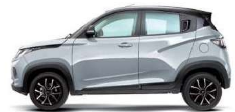
Moondust Silver/Metallic Black