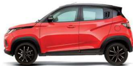
Highway Red/ Metallic Black