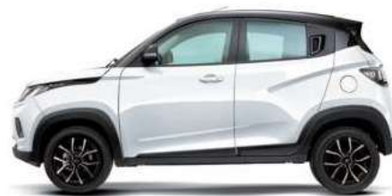
Pearl White/Metallic Black