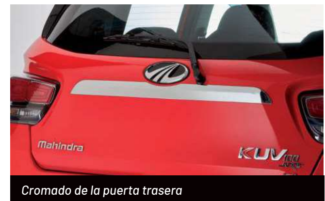
Cromado de la puerta trasera