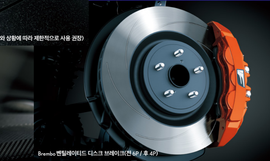
Brembo 벤틸레이티드 디스크 브레이크(전 6P / 후 4P)