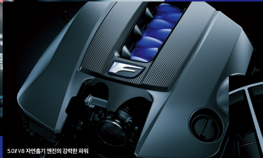
5.0L V8 자연흡기 엔진의 강력한 파워