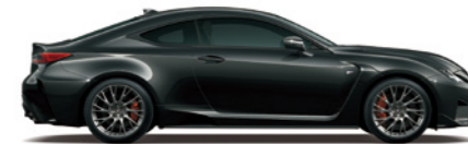
Graphite Black GF.