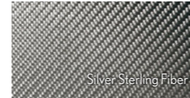
Silver Sterling Fiber