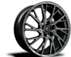
19인치 단조 알루미늄 휠