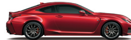
Radiant Red CL.