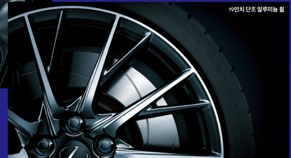
19인치 단조 알루미늄 휠