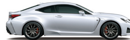
White Nova GF.