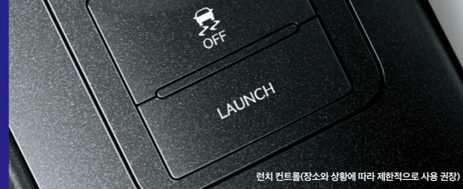
런치 컨트롤(장소와 상황에 따라 제한적으로 사용 권장)