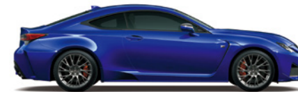
Heat Blue CL.