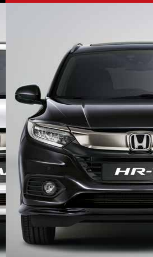
RUSE BLACK METALLIC