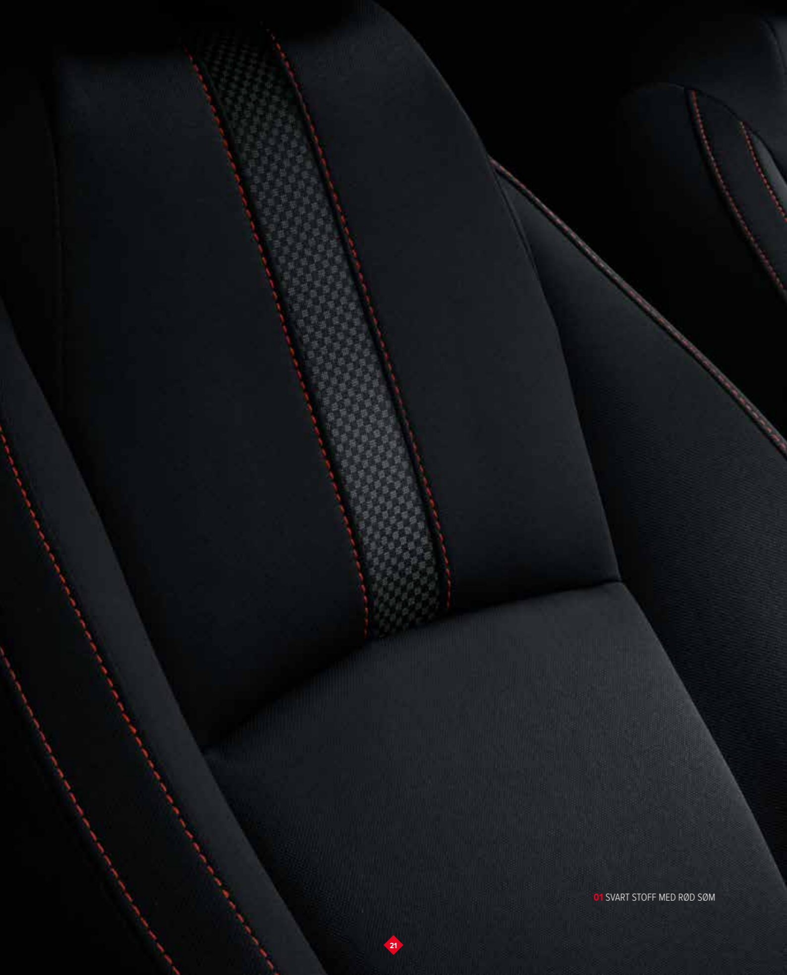
01 SVART STOFF MED RØD SØM