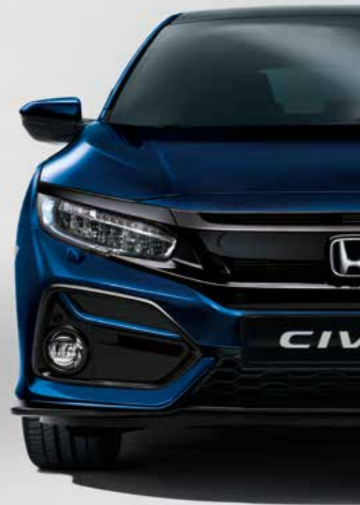
OBSIDIAN BLUE METALLIC