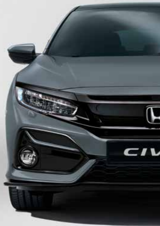
SONIC GREY PEARL