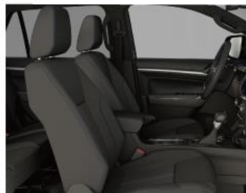
时尚运动蓝色缝线内饰