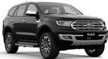
Panther Black 银沙黑