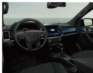
奢华转水印蓝宝石控制台