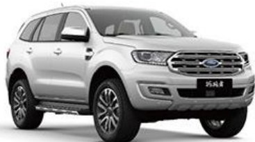
Peal White 珠光白