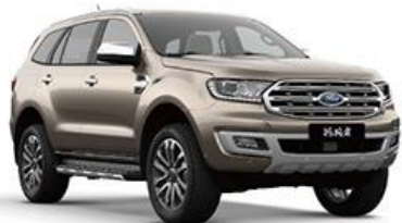
Diffused Silver 盐湖灰