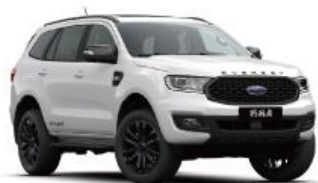
Peal White 珠光白