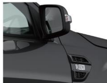
熏黑后视镜翼子板