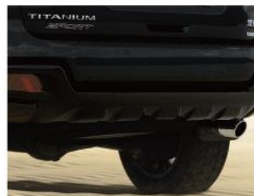
熏黑前后保排气管造型