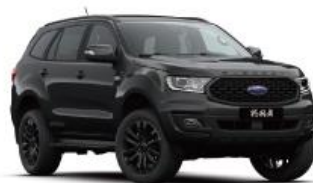
Panther Black 银沙黑