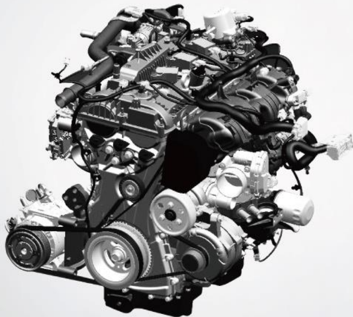
2.3L EcoBoost GTDI 涡轮增压汽油发动机

2020款福特撼路者配备EcoBoost 2.3T涡轮增压发动机，采用D-VVT技术和双流道技术，能够极大程度降低发动机在低速时涡轮迟滞，提升动力响应，持续输出强劲动力。再加上EcoBoost增压和可变机油压力机油泵主动控制技术，以及四桃尖式低摩擦高压油泵技术，可以提高发动机工作寿命的同时，进一步降低发动机噪声和油耗。