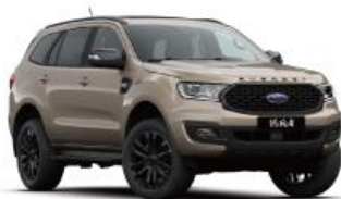
Diffused Silver 盐湖灰