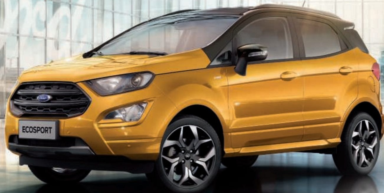
EcoSport ST-Line in Sika-Gelb Metallic und Kontrastfarbe Obsidian-Schwarz Metallic mit 18"-Leichtmetallrädern, im 5x2-Speichen-Y-Design, in Schwarz, glanzgedreht (Wunschausstattung).

Kraftstoffverbrauch und CO 2 -Emissionen für alle in der Broschüre aufgeführten Modelle nach dem vorgeschriebenen Messverfahren (§2 Nrn. 5, 6, 6a Pkw-EnVKV in der jeweils geltenden Fassung): 6,1 - 4,0 l/100 km (kombiniert); 137 - 104 g/km (kombiniert).