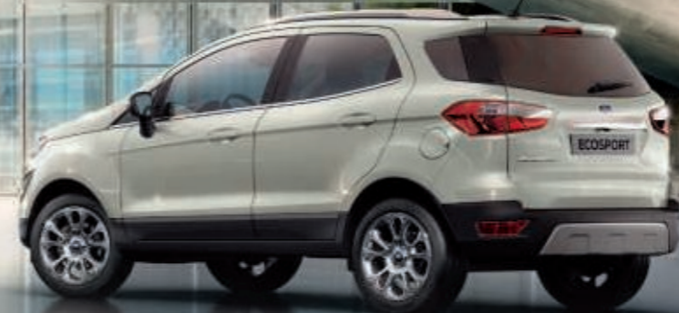
EcoSport Titanium in Metropolis-Weiß Metallic mit 17"-Leichtmetallrädern, im 5x2-Speichen-Design (Wunschausstattung).

Hinweis: Die jeweiligen Verbrauchs- und Emissionswerte finden Sie auf Seite 30 dieser Broschüre.