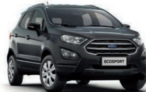
Cool & Connect

Ein robustes Design, beeindruckende integrierte Technologien und eine Auswahl an effizienten Motoren tragen zur Attraktivität des Ford EcoSport Trend bei.