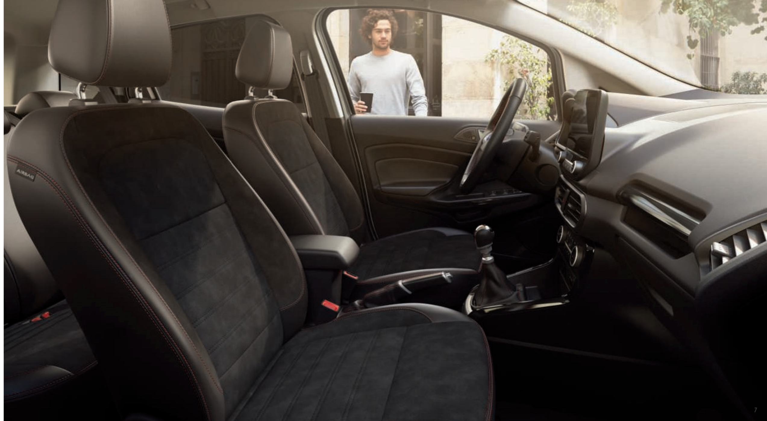
Abbildung zeigt Ford EcoSport ST-Line Innenraum, mit Sensico Kunstleder-Stoff-Polsterung in Wildleder-Optik und roten Ziernähten (Wunschausstattung).

Das beheizbare Lenkrad des Ford EcoSport bietet Ihnen zusätzlichen Komfort an kalten Wintertagen. Die Heizung lässt sich einfach per Tastendruck einschalten.