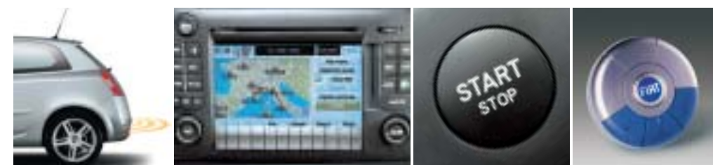
Sensore di retromarcia, vi avverte di ogni ostacolo.