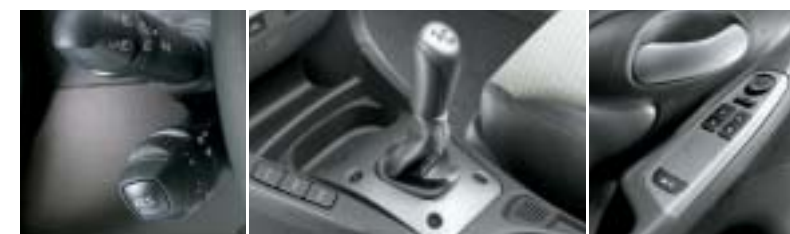
Il Cruise Control controlla e mantiene la velocità di crociera.