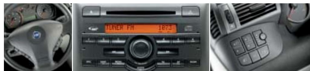
Autoradio con lettore Cd e MP3.