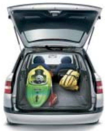
Soglia ribassata per facilitare l'accesso al bagagliaio.