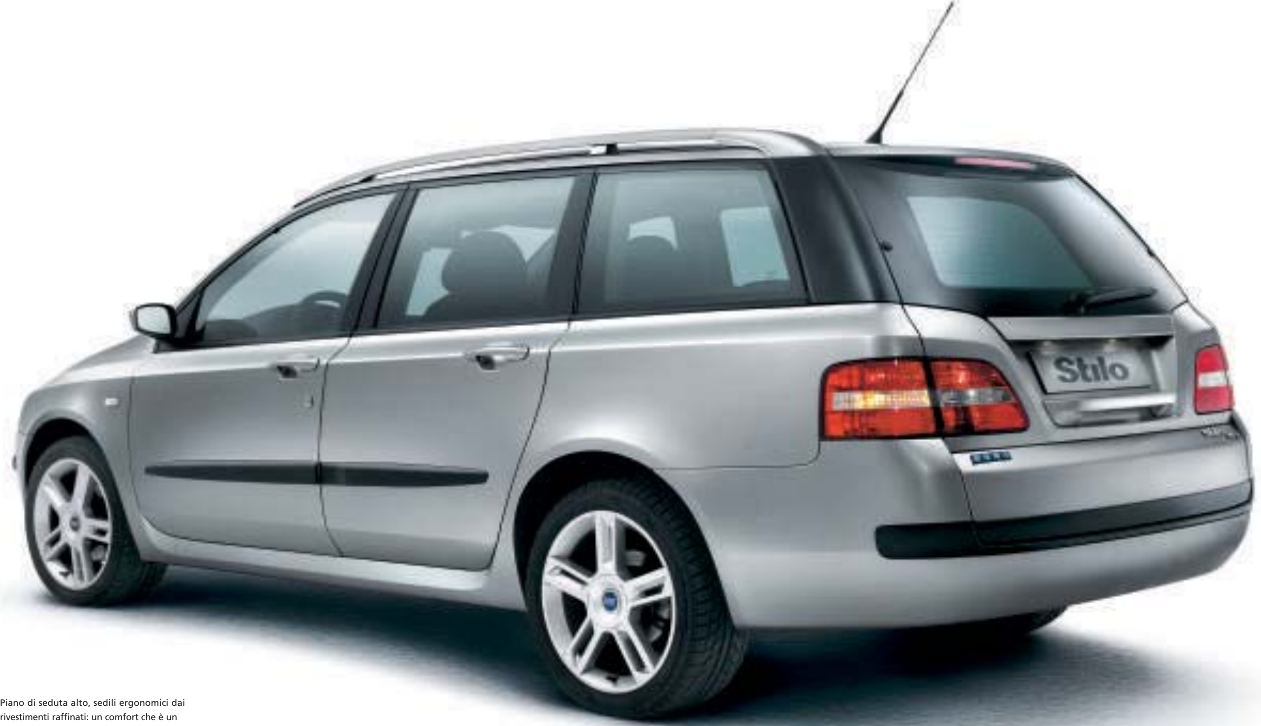
Piano di seduta alto, sedili ergonomici dai rivestimenti raffinati: un comfort che è un vero invito al viaggio.