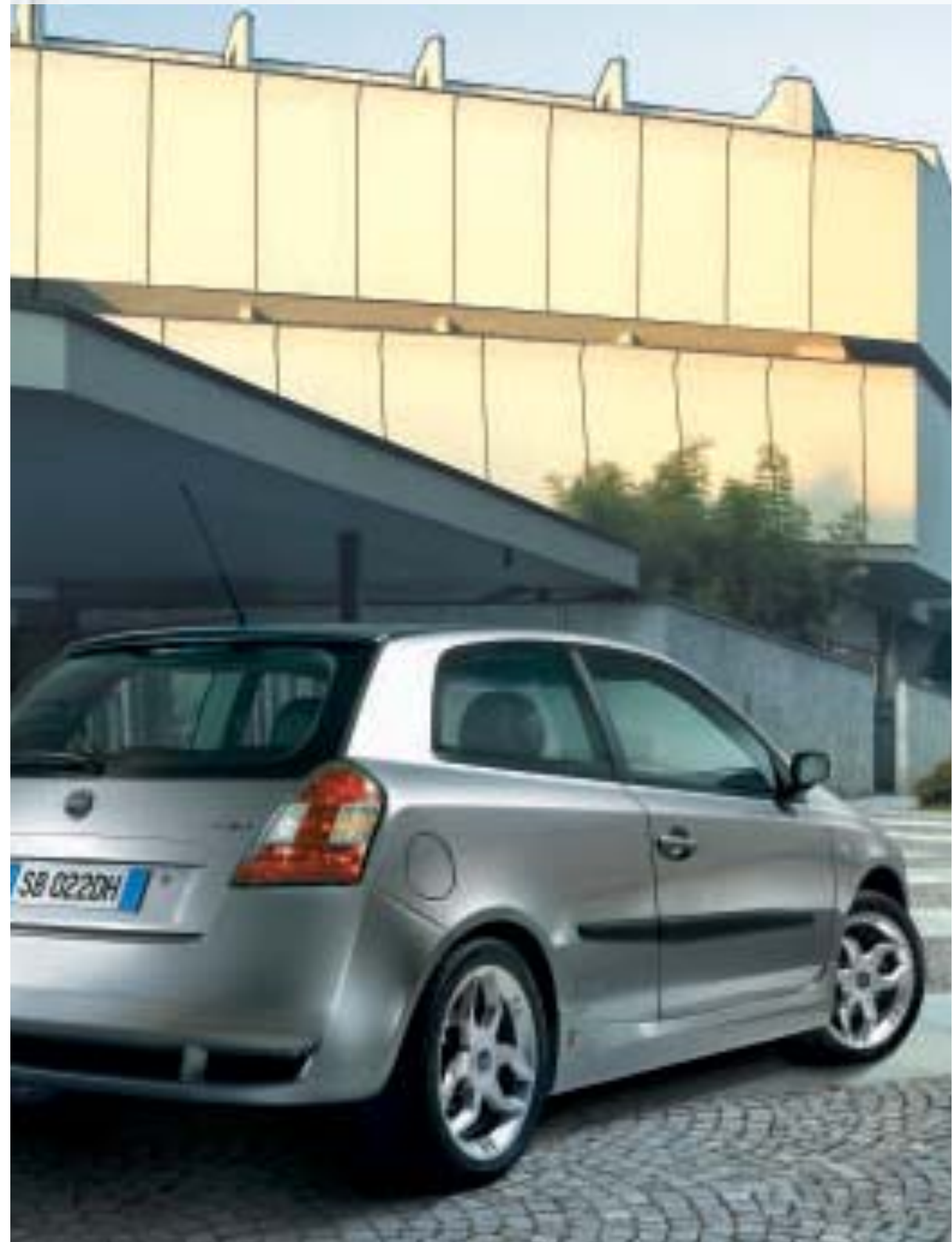
Kit allestimento sportivo Zender.