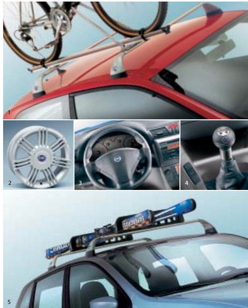
1 - Barre portatutto con portabici.

Fiat Stilo vi propone una serie ricchissima di accessori originali, per la famiglia, per il tempo libero o per personalizzare l'auto come più vi piace. Dettagli sportivi, soluzioni intelligenti per sfruttare gli spazi e viaggiare in sicurezza anche con i bambini: il catalogo completo Lineaccessori Fiat è disponibile dal vostro concessionario.