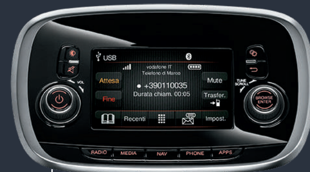
UCONNECT™ RADIO DAB

The 7" Uconnect™ System, with Apple CarPlay and Android Auto™ integration, is equipped with a 7" high resolution touchscreen display with capacitive technology.