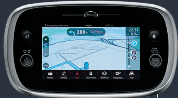
يوكونيكت™ إتش دي الملاحي ٧ بوصة بنظام البث الصوتي الرقمي