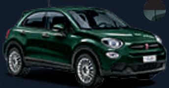
٠١٨ أخضر تكنو* 018 Techno Green*

* Available mono-color and bicolor (black roof)