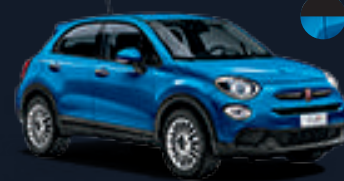
٠١٨ أزرق إيطالي* 018 Italia Blue*