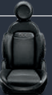
جلد أسود بلهسات من الجلد الصناعي مدرور بلون رمادي (٤٨٤)

Leather brown with techno-leather inserts (564)