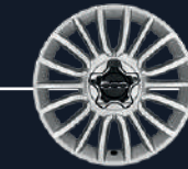
٤٣١ - عجلات من الألومنيوم المسبوك ١٧ إنش اختيارية في كونيك