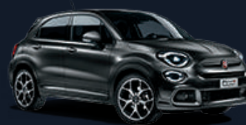
١٨٥ رمادي مودا ناشف 185 Matt Moda Grey