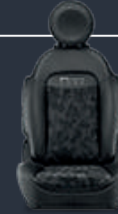
قمماش كاهو بلهسات من القينيل (3L5)