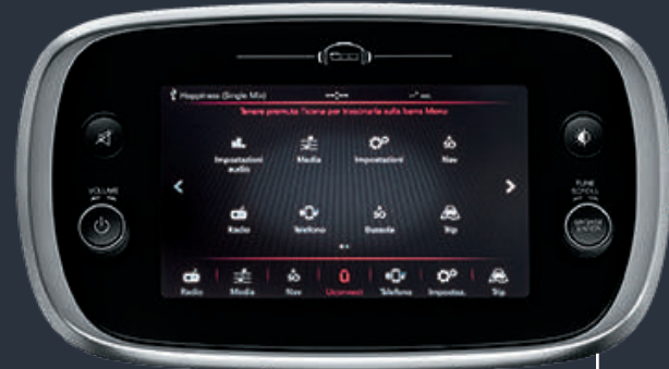
يوكونيكت™ إتش دي ٧ بوصة بنظام البث الصوتي الرقمي

راديو يوكونيكت™ مع بلوتوث، وصلة صوت إضافية ومنفذ يو إس بي. بوابة دخولكم إلى عالم يوكونيكت™. مدمج كلياً في لوحة القيادة ومزود بأزرار تحكم مدمجة في عجلة القيادة. تتيح واجهة البلوتوث (تطبيق الـيدين) بإجراء وتلقي المكالمات، إرسال الرسائل النصية، وتشغيل الموسيقى، كلها في هاتفكم المحمول.