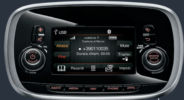
راديو يوكونيكت™ بنظام البث الصوتي الرقمي