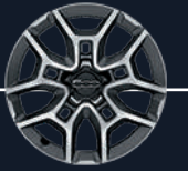
56J - عجلات من الألومنيوم المسبوك ١٨ إنش قياسية في كروس