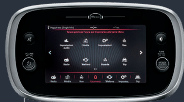
UCONNECT™ 7" HD DAB

The Fiat 500X has bags of style and technology. Boost your connectivity with the Uconnect™ 7" HD LIVE touchscreen with "tablet effect" and HD display : offering a wide range of functions, from Uconnect™ LIVE services offered as standard, with a hands-free system, Bluetooth® technology, and voice recognition. Available with Apple CarPlay integration and Android Auto™ compatibility, the system has a user-friendly interface that allows you to manage maps, music, contacts, and more. All safely within reach while you drive.