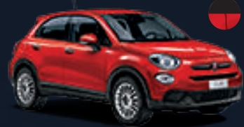
١٧٦ أحمر سيدوزيون* 176 Seduzione Red*