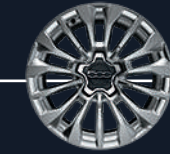
٤٣٢ - عجلات من الألومنيوم المسبوك ١٧ إنش اختيارية في كروس