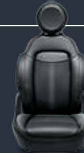
قمماش Arrow بلهسات فينيل مدرور بلون أحمر / رمادي اختياري (٠٧٣)

Arrow fabric with vinyl inserts and red/grey piping (073) OPT