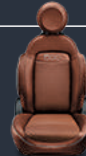
جلد بني بلهسات من الجلد الصناعي (0٦٤)

Leather black with techno-leather inserts and ivory piping (539)