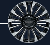
4AV - عجلات من الألومنيوم المسبوك ١٧ إنش اختيارية في كروس