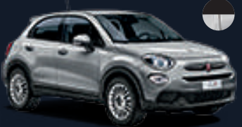
٣٤٨ رمادي أرجنتو* 348 Argento Grey*