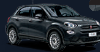
٦٧٩ رمادي مودا* 679 Moda Grey*