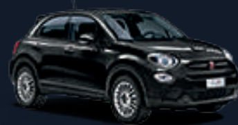
٦٠١ أسود سينما 601 Cinema Black