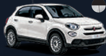
٢٩٦ أبيض جيلاتو* 296 Gelato White*