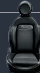
جلد أسود بلهسات من الجلد الصناعي مدرور بلون عاجي (0٣٩)

Arrow fabric with vinyl inserts and red/grey piping (073) OPT