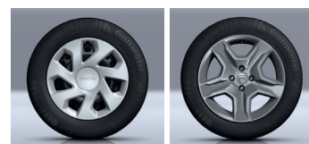
ENJOLIVEUR 15" GROOMY JANTES ACIER 16" BAYADÈRE DARK METAL