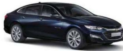
미드나잇 블루 (G5J)