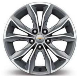
17인치 알루미늄 휠