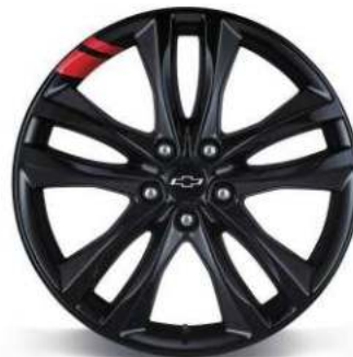
NEW 19인치 블랙 레드라인 알루미늄 휠 (레드라인 전용)