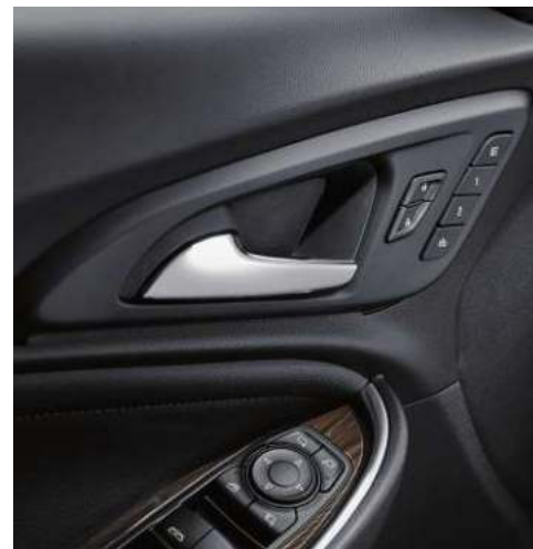
통합 메모리 기능(운전석 시트, 아웃사이드 미러) 뒷좌석 열선시트