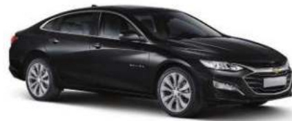
모던 블랙 (GBO)