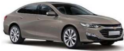
첼시 브라운 (GNM)