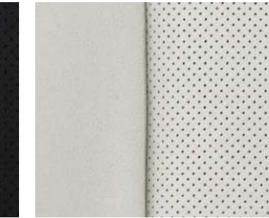
프리미엄 천공 가죽 시트 (크림 베이지) E-Turbo Premier & 프라임 세이프티 / 2.0T Premier 스페셜

※ 위의 이미지는 시트 / 인테리어 색상 참조용이므로, 사양은 모델에 따라 다르게 적용됩니다. (트림별 자세한 사양은 해당 월의 가격표를 참조하시기 바랍니다.)