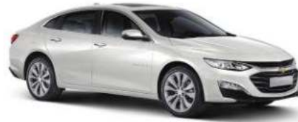
스노우 화이트 펄 (GP5)