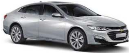
스위치블레이드 실버 (GAN)