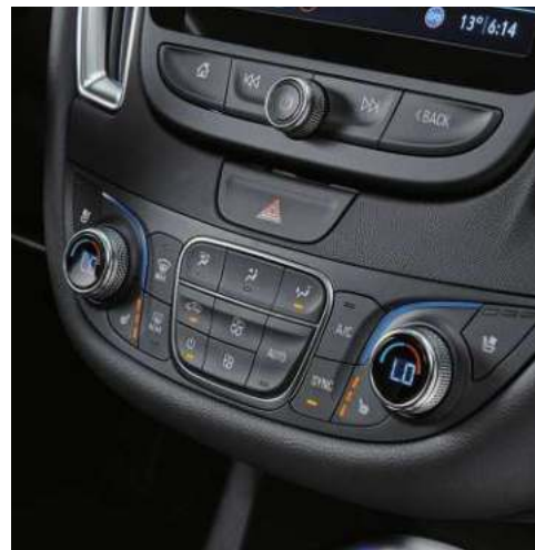
크리스탈 LED 주간주행등 운전석 & 동반석 3단 통풍시트 좌우 독립식 전자동 에어컨