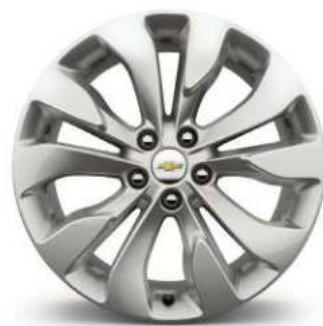
19인치 메탈릭 알루미늄 휠