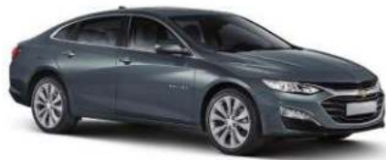
다크 나이트 그레이 (GUN)