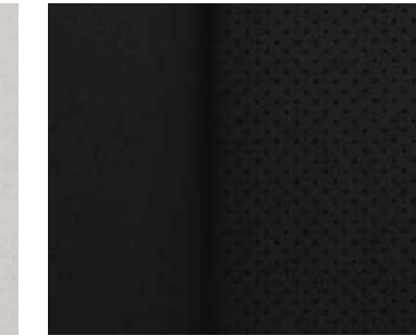
프리미엄 천공 가죽 시트 (블랙) E-Turbo Premier & 프라임 세이프티 / 2.0T Premier 스페셜 / E-Turbo & 2.0T 레드라인