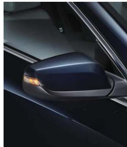
LED 방향지시등 일체형 아웃사이드 미러 와이드 크롬 듀얼 브라이트 머플러 팁 대용량 트렁크