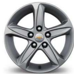
16인치 알루미늄 휠