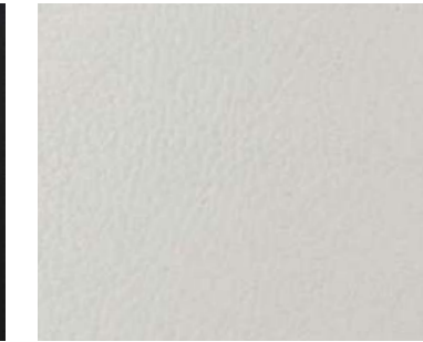
프리미엄 가죽 시트 (크림 베이지) E-Turbo LT 디럭스 / 2.0T LT 스페셜