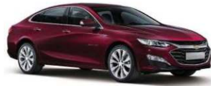
NEW 밀라노 레드 (GFM)