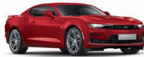
플레이밍 레드 (G7C)