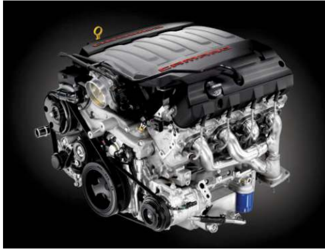
6.2 V8 엔진 마그네틱 라이드 컨트롤