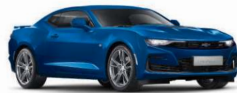
NEW 리버사이드 블루 (GKK)