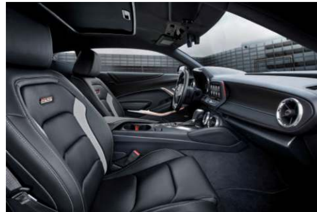
젯블랙 인테리어 & 가죽시트