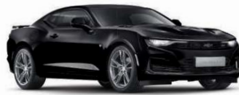
택시도 블랙 (GBA)