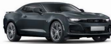
다크 섀도우 그레이 (GJI)