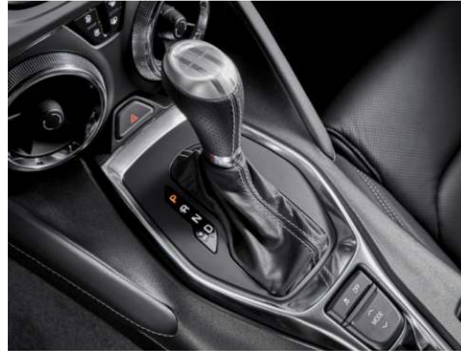
하이드라매틱 10단 자동변속기 드라이브 모드 셀렉터 / 전자식 주차 브레이크(EPB)