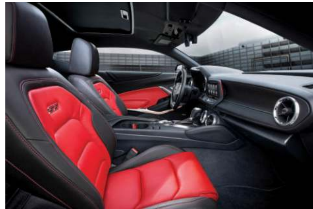
스폴피온 레드 인테리어 & 가죽시트