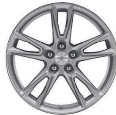
20인치 머신드 알로이 휠