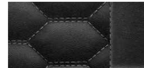
ブラック(ロックグレーステッチ) [ファインナッパレザー]