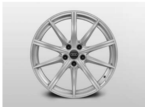
10スポークデザインアルミホイール 8J-19、インセット26、PCD112 (ウインタータイヤ用)

Audiの美しいスタイリングや高い実用性をさらに輝かせる、数々の純正アクセサリをご用意いたしました。Audiと過ごす時間をひととき心地よく、さらに自分らしく。あなたにとってこの上なく魅力的なAudiに仕立ててください。