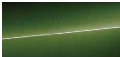
ソノマグリーン メタリック