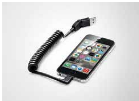
AMI接続アダプター 標準装備のAMIに取り付けて使用するiPhone®/iPod®等のUSB接続アダプター。