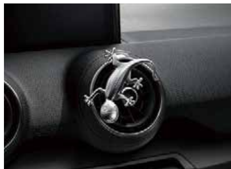
デザインゲッコー アルミ塗装のゲッコーマスコット。エアバントに差し込んだり、マグネットでお好みの場所に固定できます。