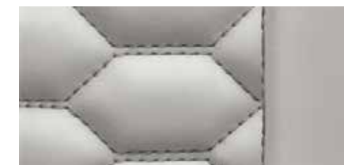
ルナシルバー(ロックグレーステッチ) [ファインナッパレザー]