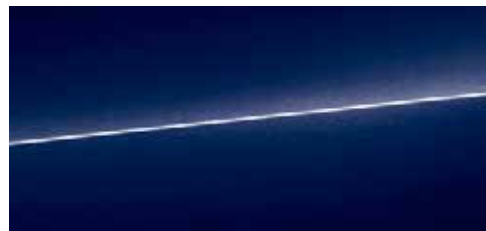
ナバーブルー メタリック