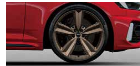
アルミホイール 5アームスポークデザイン マットブロンズ 9J×20+275/30 R20タイヤ*