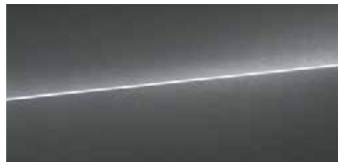
デイトナグレー パールエフェクト