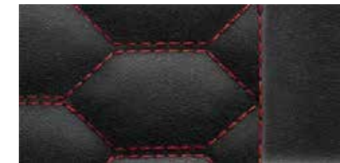
ブラック(クレストドレッドステッチ) [ファインナッパレザー]