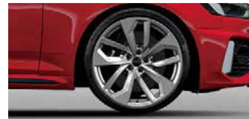
アルミホイール 5ダブルスポークエッジデザイン 9J×20+275/30 R20タイヤ