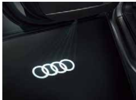
ドアエントリーライト ドア開閉時に、足元を魅力的に照らします。フォーリングス、フォーリングス&ゲッコー、Sロゴマークの3種類から選択できます。