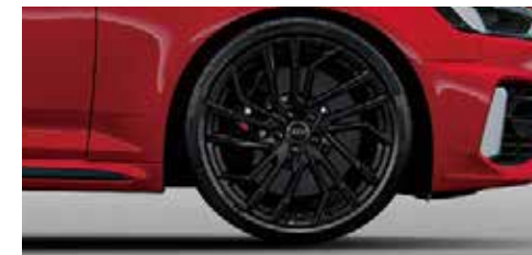
アルミホイール 5セグメントスポークデザイン グロスブラック 9J×20+275/30 R20タイヤ*