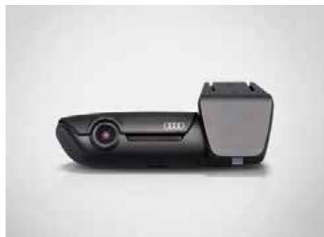
Audi ユニバーサルトラフィックレコーダー Audi専用デザインのドライブレコーダーです。専用アプリにてスマートフォン上で操作できます。レーダー感知作動による駐車監視や、イベントの自動録画、GPSによる自車位置検知など、多機能と高機能を兼ね備えています。フロント用とフロント&リヤ用があります。