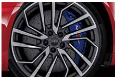
セラミックブレーキ(フロント) カラーブレーキキャリパー ブルー* *オプション