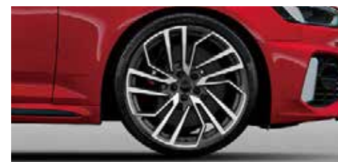
アルミホイール 5セグメントスポークデザイン マットチタングレー 9J×20+275/30 R20タイヤ*