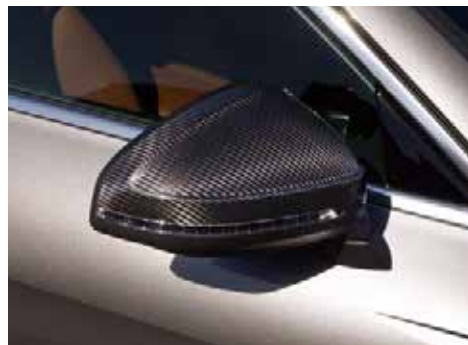
カーボンミラーハウジング 軽量化とスポーティさを演出します。