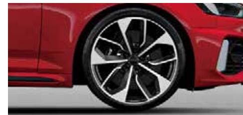
アルミホイール ダブルスポークエッジデザイン グロスアンスラサイトブラック ポリッシュ 9J×20+275/30 R20タイヤ*