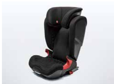
チャイルドシート Kidfix XP 幼児用シートは卒業、という小学生以下の児童用ジュニアシートです。ISO FIX固定フックとの一体型なので取り付けも簡単で、しかも安全です。座面を分割可能。22kgを超えるお子さま用に単独で使えます。ヘッドレスト、背もたれの角度調整が可能です。カラー：ブラック