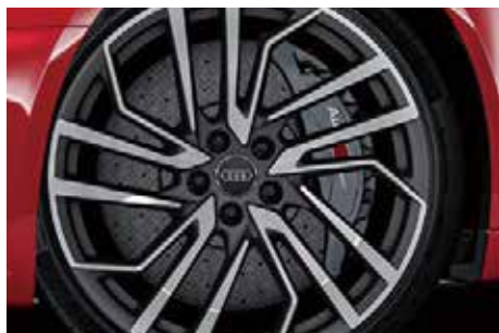
セラミックブレーキ(フロント) ブレーキキャリパー アンスラサイトグレー*