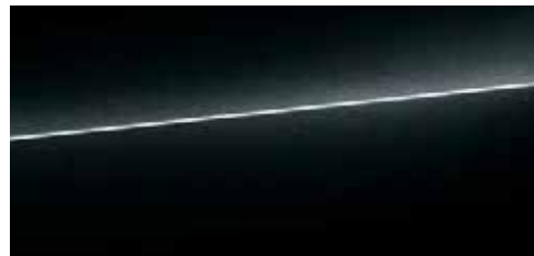
ミストブラック メタリック