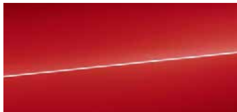
タンゴレッド メタリック