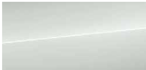
グレイシアホワイト メタリック