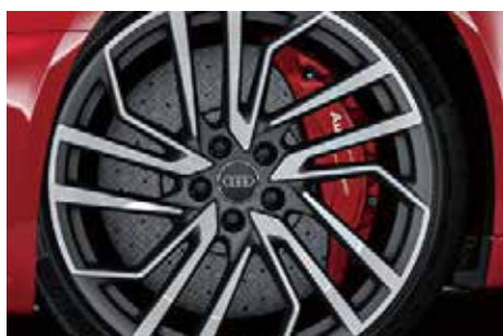
セラミックブレーキ(フロント) カラーブレーキキャリパー レッド*