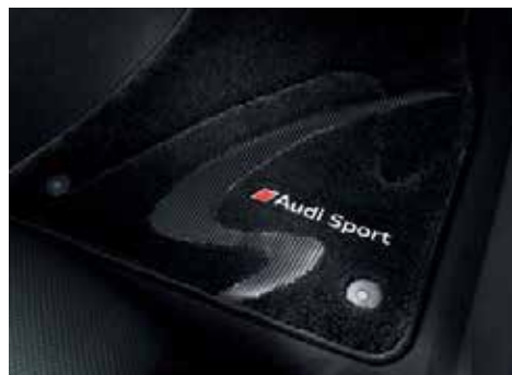
フロアマット(プレミアムスポーツ) 高密度カーベットにリアルカーボンとアルミニウム製のエンブレムを使用。素材には花粉等のアレル物質を吸着し、雑菌の増殖を抑制させる「プレミアムクリーン」を使用した、車内をクリーンに保つ、高品質なフロアカーベットです。カラー：ブラック