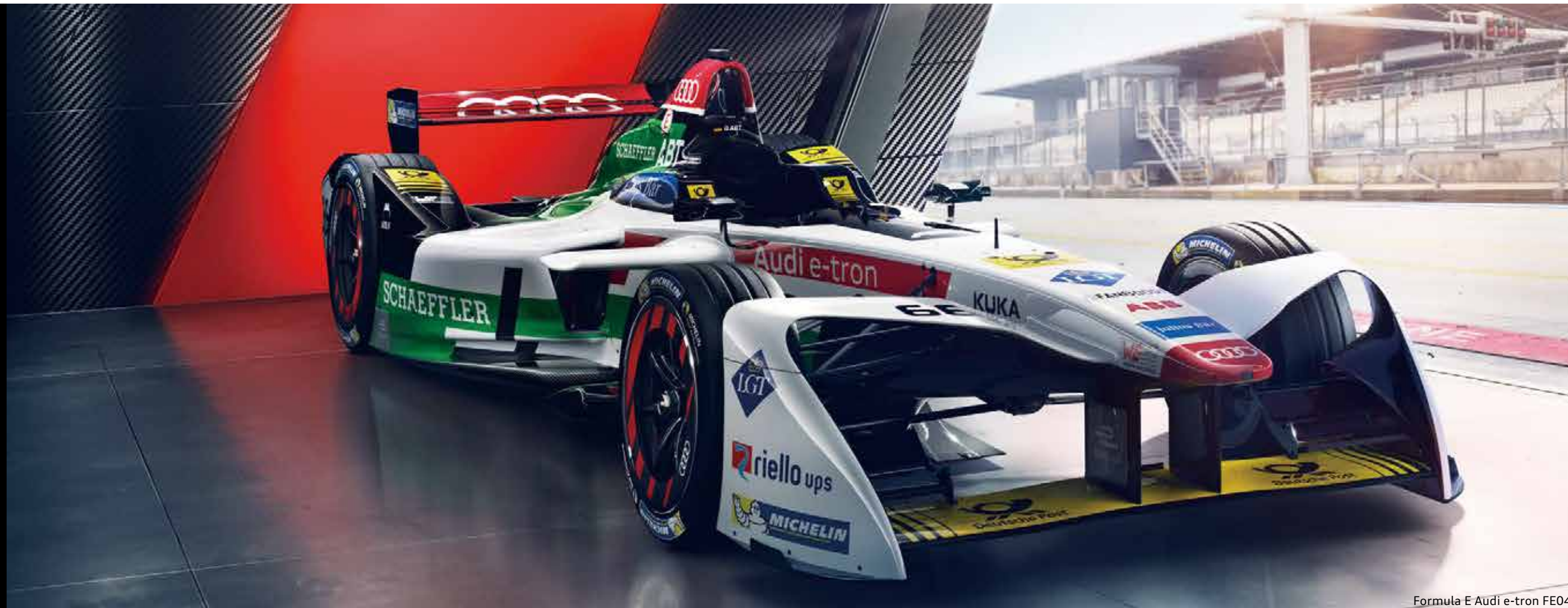
Formula E Audi e-tron FE04

Formula Eで参加初年度チーム優勝。 Audiの創生期から、電気自動車の未来の技術を磨くFormula Eまで。 モータースポーツへの挑戦こそ、進化の原動力。