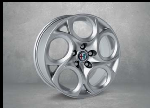
5YN 17"-Leichtmetallfelgen VELOCE. 7,5J x 17 mit Bereifung 225/45 R17