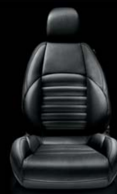
Exklusiv-Leder VENERE Nero (Innencode 408 ) (optional)