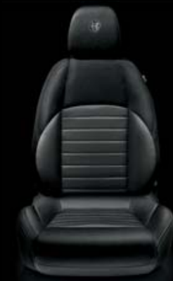
Stoff SUPER Nero-Antracite (Innencode 123 )