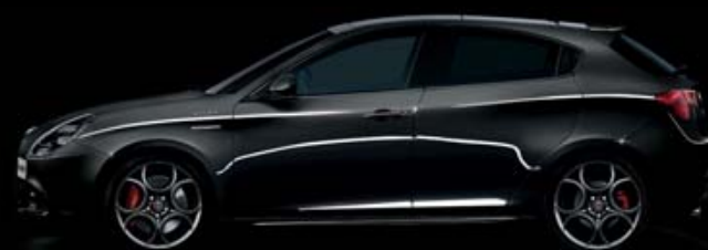
601 Nero Alfa