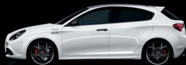
217 Bianco Alfa