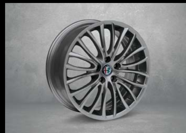
73Z 18"-Leichtmetallfelgen LUSSO. 7,5J x 18 mit Bereifung 225/40 R18