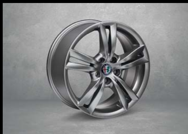
421 17"-Leichtmetallfelgen SPORTIVO. 7,5J x 17 mit Bereifung 225/45 R17