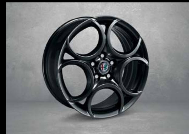
5FB 18"-Leichtmetallfelgen CLASSICO dunkel lackiert. 7,5J x 18 mit Bereifung 225/40 R18