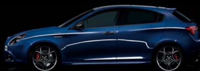
486 Blu Anodizzato