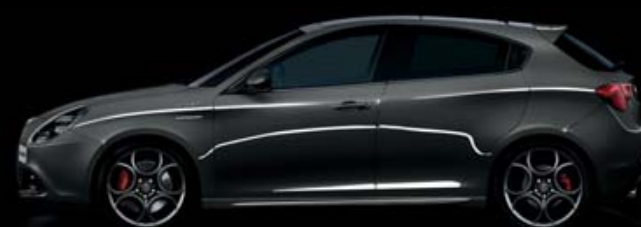
409 Grigio Lipari