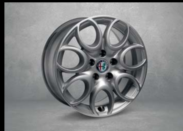
74A 16"-Leichtmetallfelgen SUPER. 7J x 16 mit Bereifung 205/55 R16