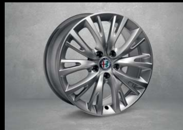
74B 17"-Leichtmetallfelgen ELEGANTE. 7,5J x 17 mit Bereifung 225/45 R17