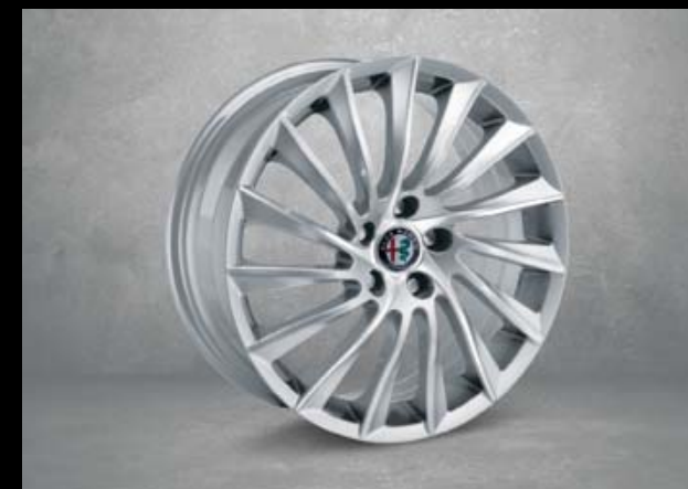
435 18"-Leichtmetallfelgen TROFEO. 7,5J x 18 mit Bereifung 225/40 R18