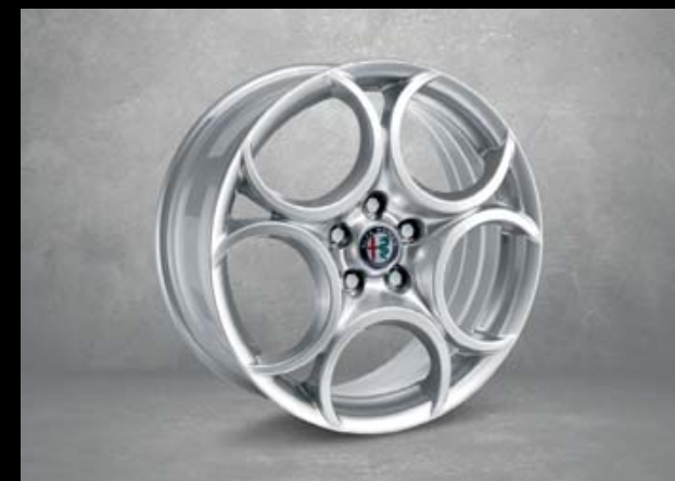
439 18"-Leichtmetallfelgen CLASSICO. 7,5J x 18 mit Bereifung 225/40 R18