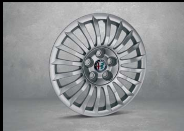
404 16"-Stahlfelgen mit Radvollblenden 7J x 16 mit Bereifung 205/55 R16