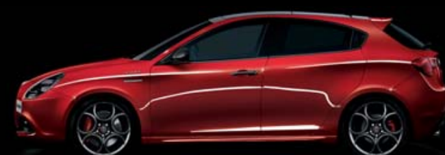
361 Rosso Competizione