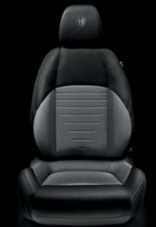
Stoff GIULIETTA Nero-Grigio (Innencode 198 )