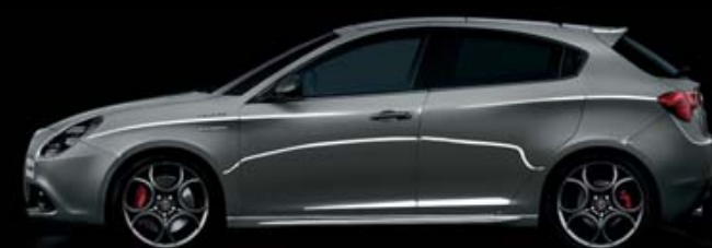
318 Grigio Stromboli