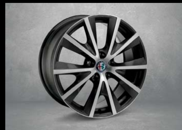
7HP 18"-Leichtmetallfelgen POTENZA. 7,5J x 18 mit Bereifung 225/40 R18

Serienmäßig • Optional ◦ Nicht erhältlich - Paketbestandteil P