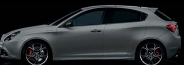
529 Grigio Magnesio