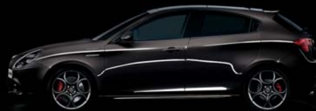
805 Nero Etna