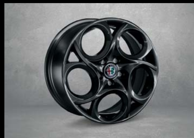
6Y8 17"-Leichtmetallfelgen VELOCE dunkel lackiert. 7,5J x 17 mit Bereifung 225/45 R17