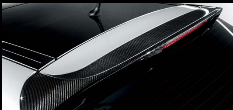
Heckspoiler aus Kohlefaser