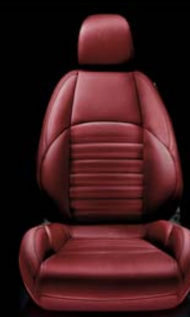
Exklusiv-Leder VENERE Rosso (Innencode 901 ) (optional)