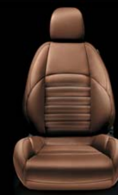
Exklusiv-Leder VENERE Tabacco (Innencode 465 ) (optional)