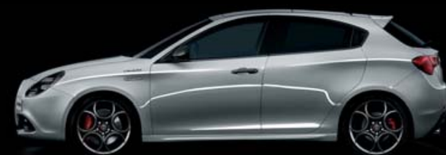
620 Grigio Silverstone