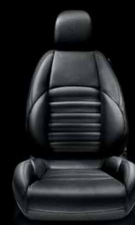
Exklusiv-Leder VENERE Nero (Innencode 923 ) (optional)