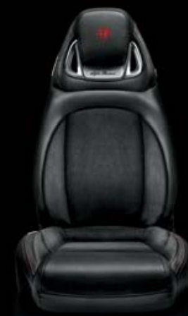
Halbschalen-Sportsitze mit Sitzbezügen in Leder und Alcantara® VELOCE Nero mit roten Nähten (Innencode 323 ) (Optional)