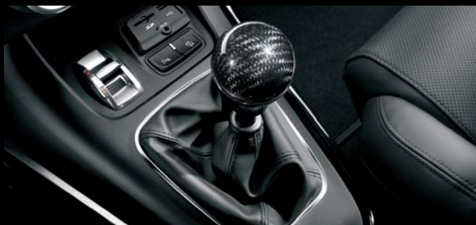
Schaltknopf aus Kohlefaser