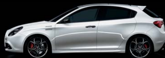
764 Bianco Lunare