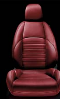
Exklusiv-Leder VENERE Rosso (Innencode 401 ) (optional)

Die Ausstattungsversion SUPER ist mit folgenden Motorisierungen verfügbar: