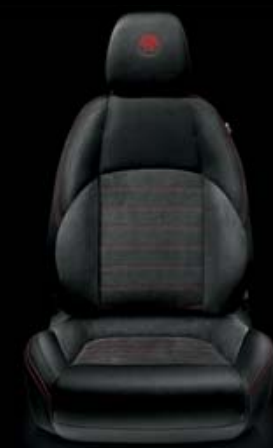
Stoff und Alcantara® SPORTIVO Nero mit Alfa Romeo Logo und roten Nähten (Innencode 308 )